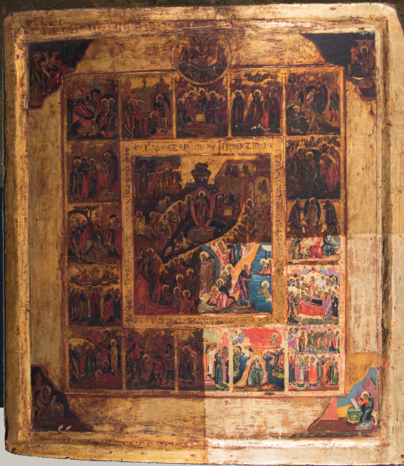
Εξ Άδου κήρυκος και Εσπέρης, Μουσείο Μπενάκη, αρ. ευρ. 3006