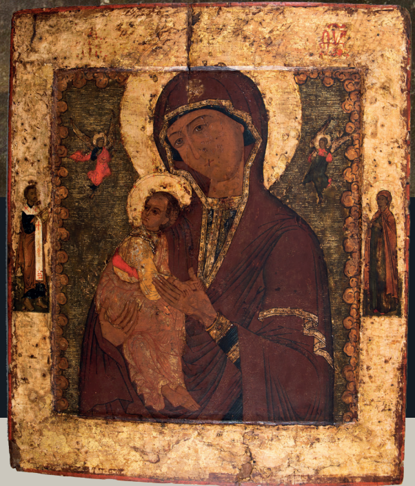
Παναγία του Πέδου, Μουσείο Μπενάκη, αρ. ευρ. 29533